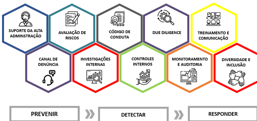
figura a seguir:

A Entidade promove esforços com foco na estruturação e funcionamento da gestão da integridade, propondo ações no sentido de organizar e fortalecer os pilares, definindo papéis e promovendo ações de divulgação, orientação e treinamento para fortalecimento da cultura de integridade institucional.